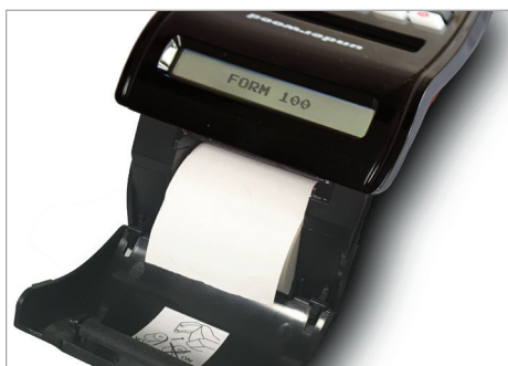
Inserimento rapido e agevole del rotolo carta