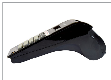
Forma compatta, linee curate e moderne